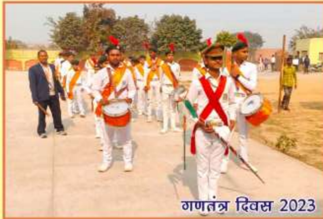
गणतंत्र दिवस 2023