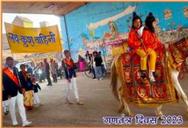
गणतंत्र दिवस 2023