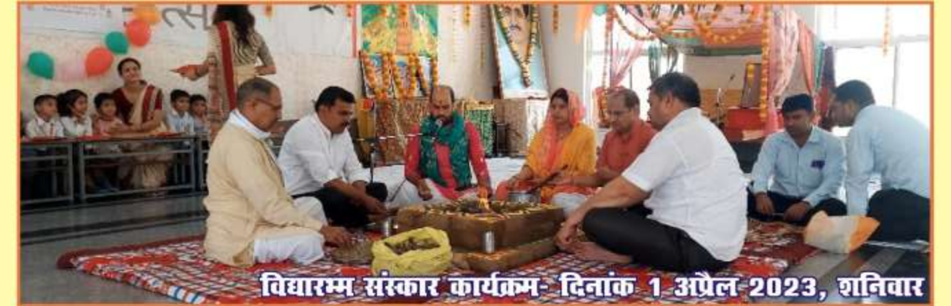
विद्यारम्भ संस्कार कार्यक्रम- दिनांक 1 अप्रैल 2023, शनिवार