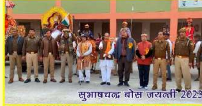
सुभाषचन्द्र बोस जयन्ती 2023