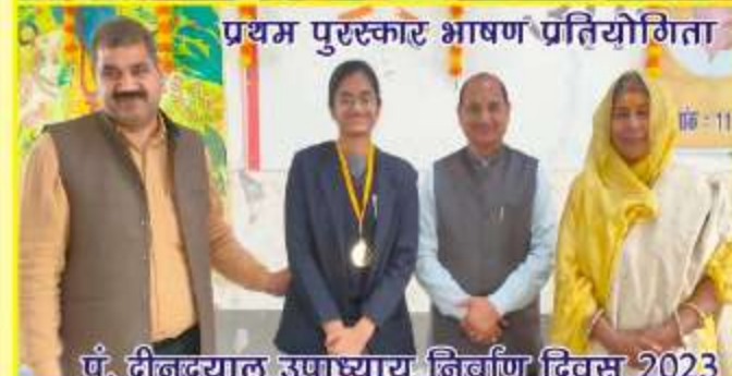
प्रथम पुरस्कार भाषण प्रतियोगिता