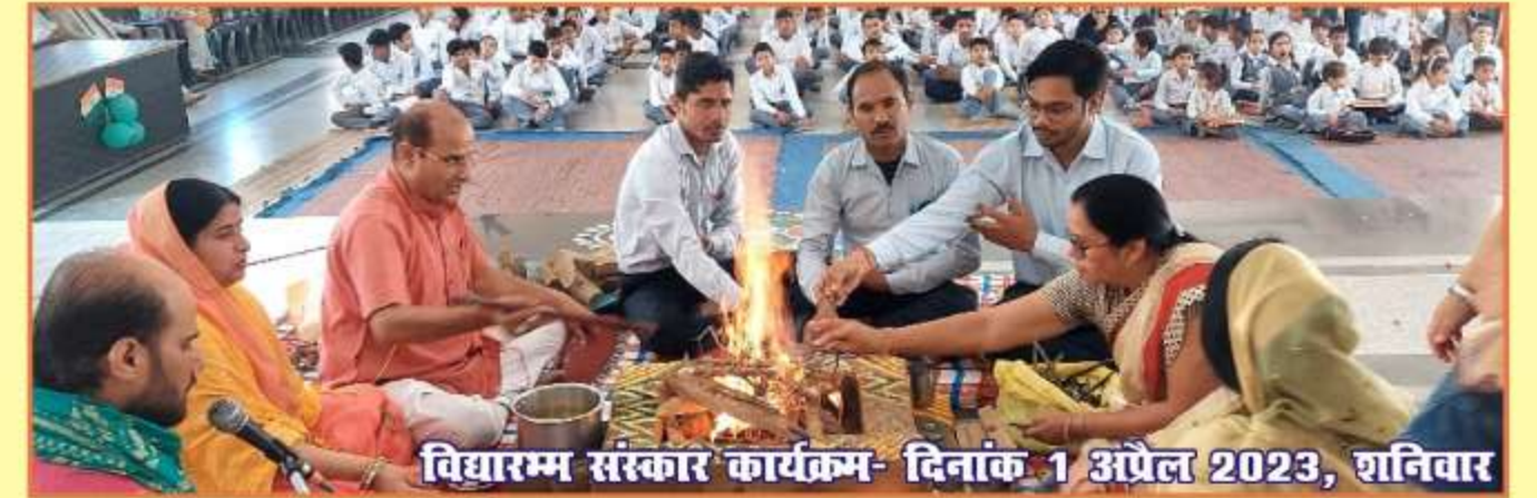
विद्यारम्भ संस्कार कार्यक्रम- दिनांक 1 अप्रैल 2023, शनिवार