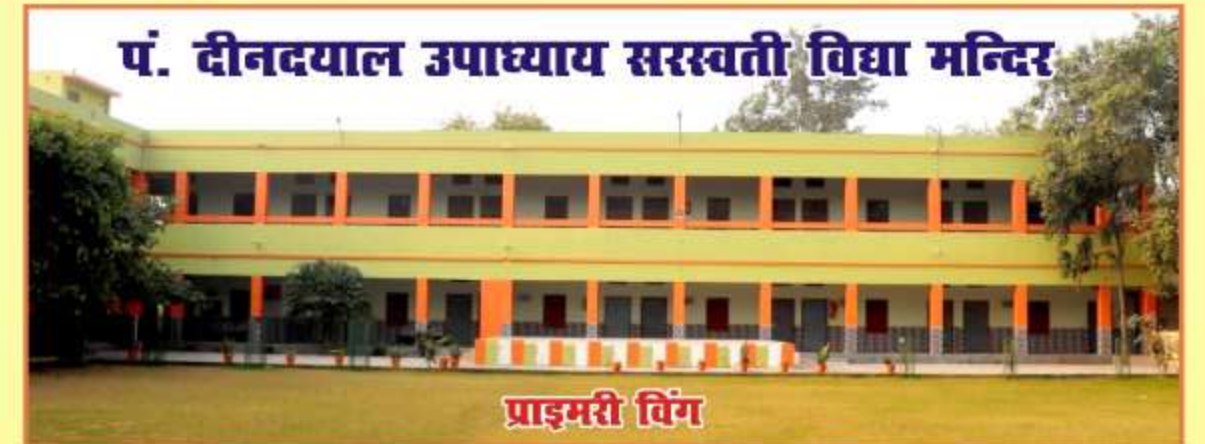
पं. दीनदयाल उपाध्याय सरस्वती विद्या मन्दिर